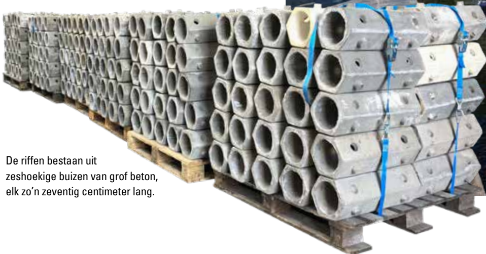
De riffen bestaan uit zeshoekige buizen van grof beton, elk zo’n zeventig centimeter lang.