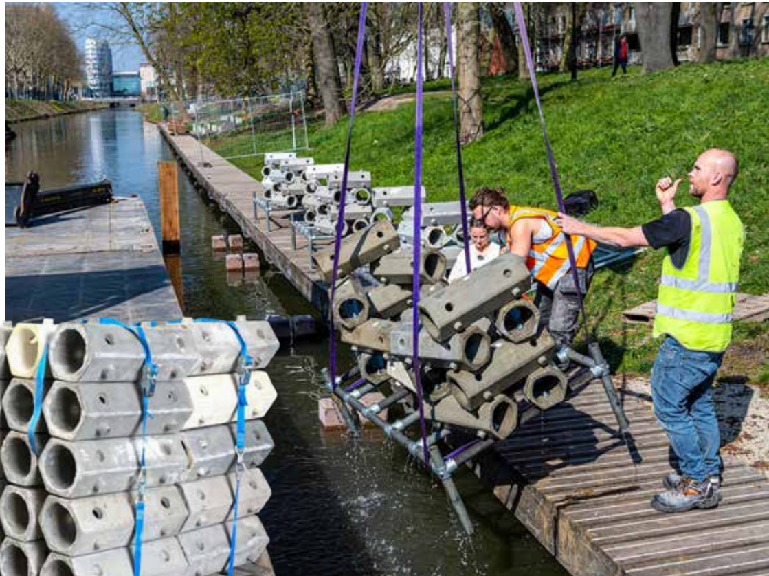
De riffen worden in de Utrechtse Catharijnesingel geplaatst.

ReefSystems ontwikkelde oorspronkelijk riffen voor oceanen en heeft – naast projecten in Nederland – ook riffen geleverd in New York, Panama en Kenia. De Bont: “In Panama en Kenia zijn kleine stukjes koraal op de structuren bevestigd en die blijken succesvol verder te groeien. Ook is er natuurlijke aangroei van koraal waargenomen. Dat is een goed teken, want koraallarven zijn erg kieskeurig waar ze op groeien.” Toch is het niet de eerste keer dat ReefSystems riffen voor zoetwater levert: bij het Marineterrein en in